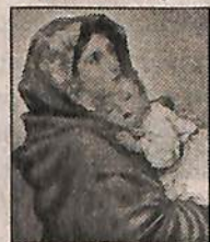
A Well Wisher Bhopal